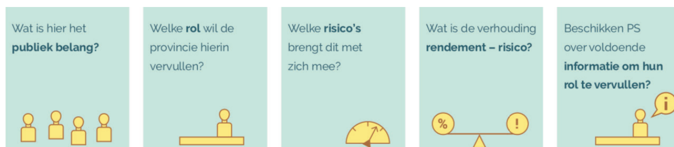
Figuur 3 Aandachtspunten voor kaderstelling en controle

meer aandacht moet worden gegeven aan deze informatie en dat moet worden gezorgd voor voldoende expertise om deze informatie te kunnen interpreteren. In principe worden in het Besluit begroting en verantwoording (BBV) eisen gesteld aan de informatieverstrekking over deelnemingen en leningen. Deze gaan niet over informatie in de programma's van de programmabegroting, maar over die in de zogenoemde paragrafen van de begroting. Het BBV stelt paragrafen verplicht over verbonden partijen (relevant bij deelnemingen), treasury (over het inzetten van beschikbare middelen) en weerstandsvermogen (relevant voor de risico's die gepaard gaan met deelnemingen en leningen). Het goed formuleren van en aandacht geven aan deze paragrafen wordt belangrijker door de actievere inzet van vermogens van provincies. Ook de balans en bepalingen daarover worden belangrijker. Dit vereist wel dat deze informatie duidelijk en toegankelijk is voor zowel volksvertegenwoordigers als andere geïnteresseerde partijen.